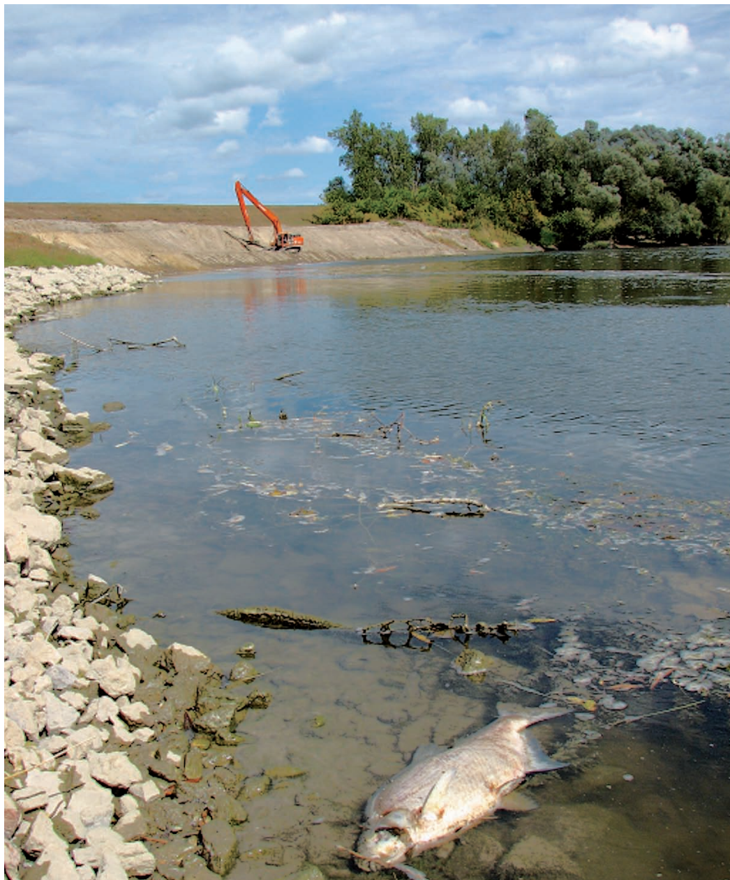
Radovi na obali i pomor ribe u Savi u Martinskoj Vesi, Hrvatska

ekoloških grupa u osnovnim i srednjim školama, zaposlenika lokalnih ureda za prostorno planiranje, zaposlenika u industriji ili komunalnoj djelatnosti. Kako veliki dio dionika nije upoznat s ovom problematikom, serijom od 5 kratkih priručnika cilj nam je pružiti osnovne informacije o: