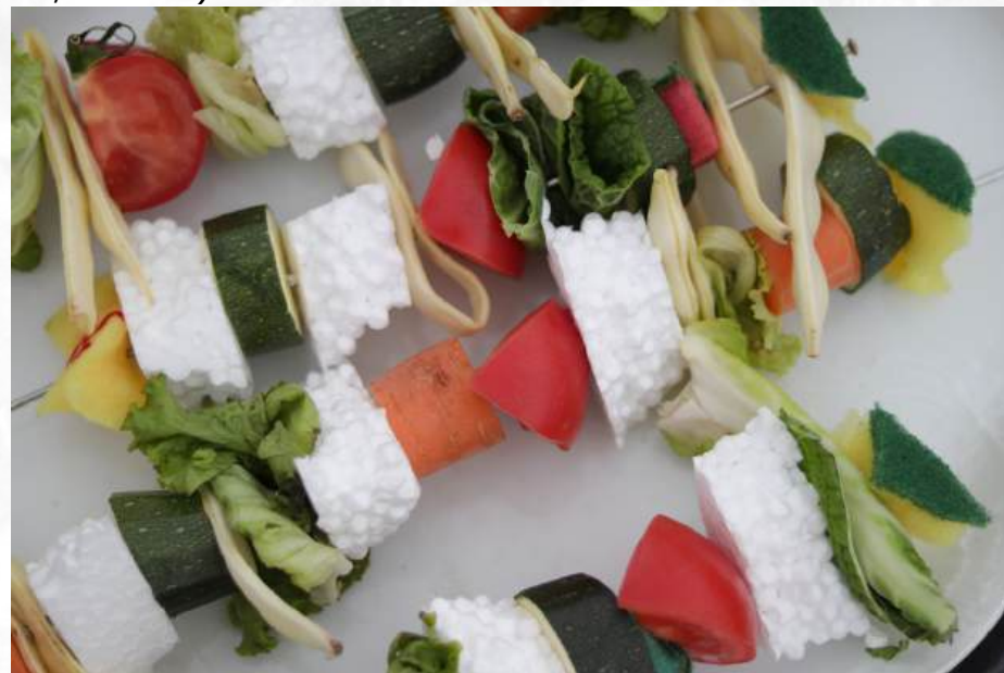
“Dan kada plastika nadjede prirodu”

Prema riječima sudionika Greenpeacea Hrvatska, usvajanje direktive EU o plastici za jednokratnu upotrebu i njeno prenošenje na nacionalnu razinu kroz zakon o gospodarenju otpadom bilo je nešto na čemu su radili od samog početka. Konačno, EU i nacionalni propisi zabranili su određene plastične proizvode za jednokratnu upotrebu (npr. plastične tanjire za jednokratnu upotrebu, pribor za jelo, slamke).