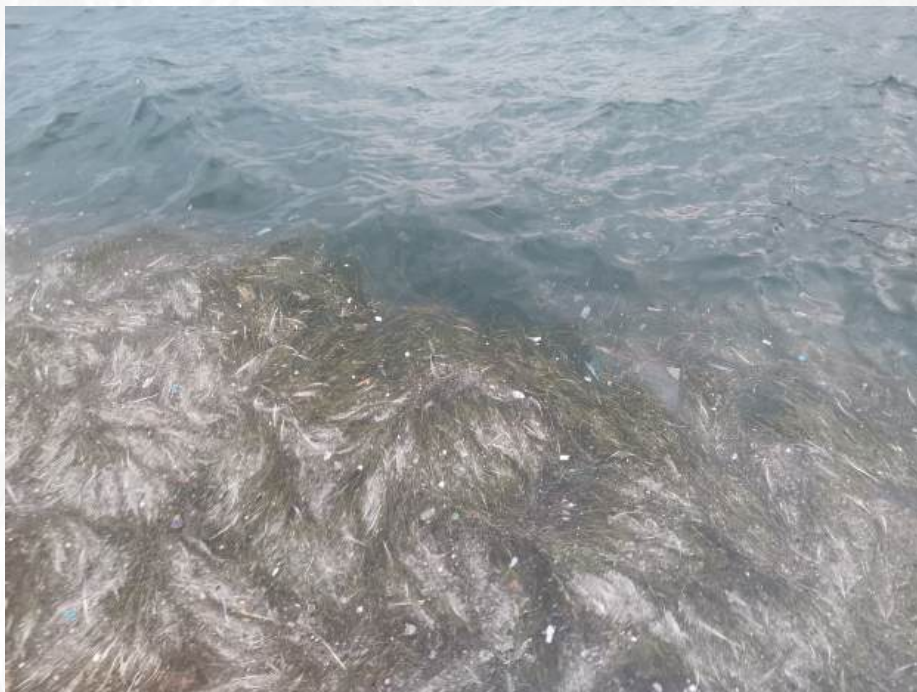
"Gušim se" More govori, ali da li slušamo?

Zajednički nazivnik u pogledu ekoloških izazova bili su problemi koji se javljaju u vezi s vodom. Bilo da se radi o nestašici vode ili onečišćenju vode. Drugi važni problemi vezani su uz sve veću sušu, koja je i posljedica i nusprodukt promjene ekosustava. Erozija tla je sama po sebi zabrinjavajuća slika za budućnost prirode. Nadalje, čini se da korištenje vjetroturbina u područjima koja su također zaštićena, pogoršava, a ne rješava potencijalne probleme. Osim toga, onečišćenje vode poslovanjem poput brodogradnje ili rudarstva stvara zagađivače u lukama i morima, osobito kada ne postoji odgovarajući plan upravljanja onečišćenjem. Konkretno, u vodi su pronađeni