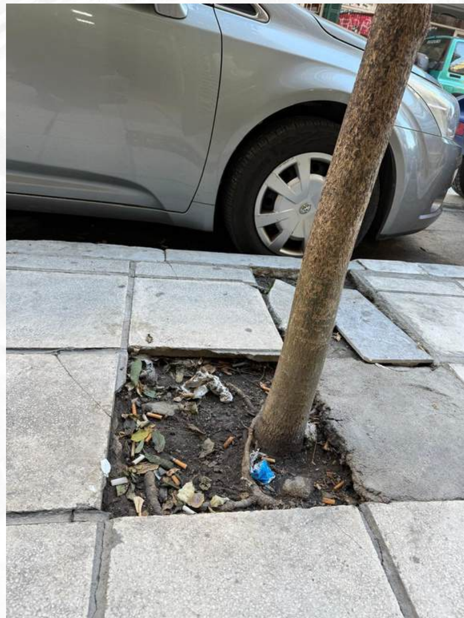
"Ukorijenjeni otpad u našim životima"