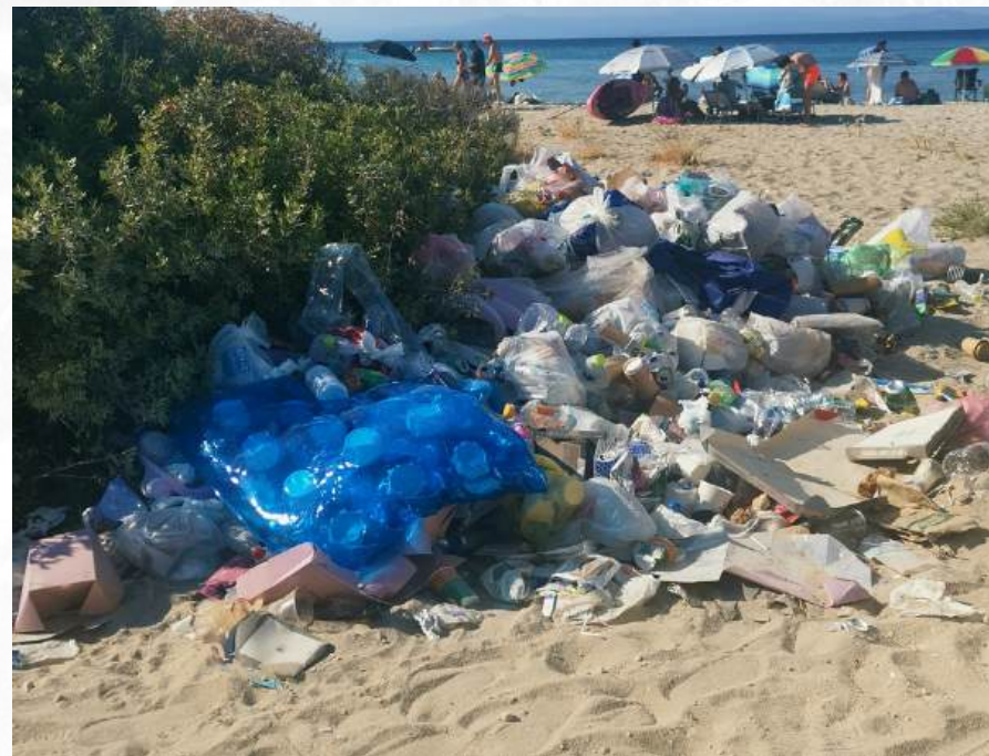
“Razglednica o kakvoj nismo sanjali”

Veliki koncertni događaji takođe treba da zagovaraju zero waste inicijative i da podstiču zajednicu da umanje upotrebu plastike. Dodatno, opštine i gradovi mogu da unaprijede prakse time što će eliminisati plastične boce, čaše i hranu sa prekomjernim pakovanjima u toku događaja, time što će se opredijeliti za održivije alternative. Primjer toga kako plastika utiče na turizam je plaža koja je svake zime preplavljena plastičnim otpadom koji nanose morske struje. Svake godine se organizuju akcije čišćenja unutar zajednice, što omogućava da ljudi vide iz prve ruke koliko se zapravo plastike akumulira u moru. Priručnik „Kako praviti manje otpada“ je jedan od prvih koji su se bavili ovom temom i mnogo puta je preuzet sa vebsajta.