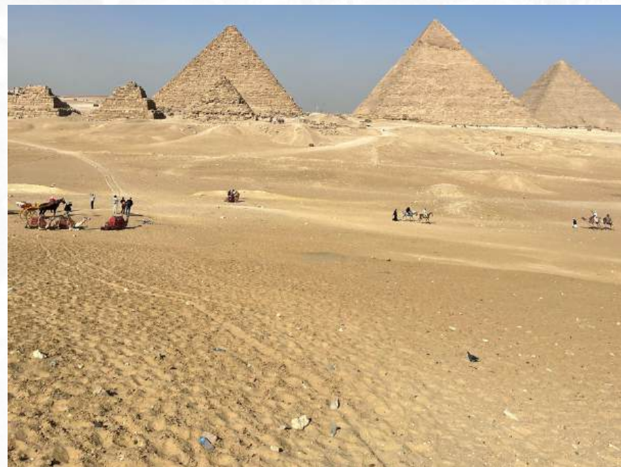
“U prvom planu piramida”

materijale koje sakupljaju, koji možda uključuju predmete koje doniraju pojedinci. Njihov proces uključuje sljedeće korake: 1) Sakupljanje, 2) Sortiranje, 3) Dizajn ideje, i 4) Korišćenje materijala za dizajn u odnosu na oblik i veličinu. Njihov cilj nije samo da stvore umjetnička djela, već takođe i da ponovo iskoriste stare predmete na efektivan način, maksimizujući njihovu korisnost. Primjeri prenamijenjenih predmeta uključuju torbe, novčanike i hemijske olovke. Ponekad moraju da dodaju nove materijale kako bi poboljšali kvalitet recikliranih proizvoda. Oni vrednuju povratne informacije od učesnika nakon svake radionice i aktivnosti. Ono što je interesantno je to da učesnici konzistentno ispoljavaju da osjećaju da im je pružen siguran prostor da razmijene misli bez osuđivanja, i cijene mogućnost da prenamijene stare predmete.