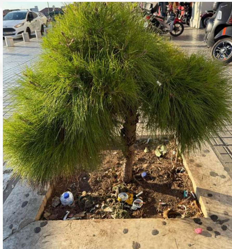
“Priroda nastoji živjeti kroz otpad”

Na primjer, u Artist Stafetë – projektni ciklus Dibra, All Green Centre je uključio mlade kroz bootcamp koji ih je podučavao tome kako umjetnost može poslužiti kao nenasilno sredstvo da se odgovori na društvene stereotipe i brige u smislu životne sredine. Učesnici su istražili različite medije, kao što su podcasti, pripovijedanje, i film, i na taj način naučili kako kreativno izražavanje može da pozove na razmišljanje i promjene.