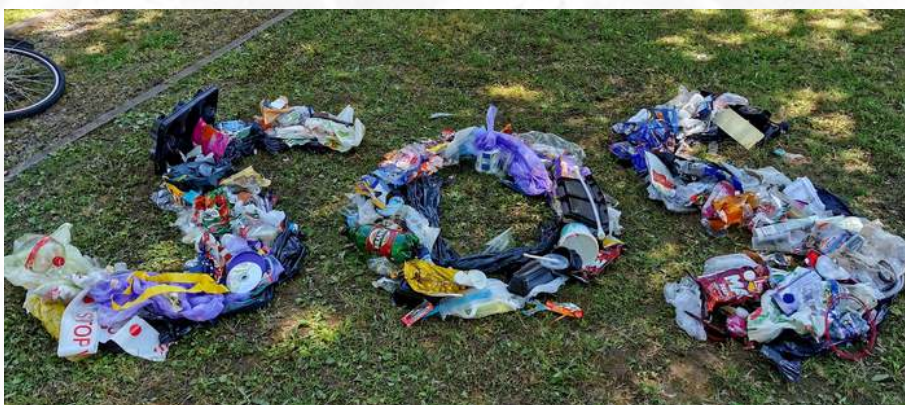
“Vrijeme je da kažemo #SOS”

Umjetnost je učinkovit medij za podizanje svijesti i poticanje uključivanja javnosti jer nudi jedinstveni kanal izvan tradicionalnih najava ili objava na društvenim mrežama. Umjetnost može očarati i angažirati ljude na načine na koje standardna komunikacija ne može. Na primjer, dok biste možda zastali na štandu neke udruge, ako se radi o temi koja vas zanima, umjetnička instalacija – bilo da ste je iskusili osobno ili online – ima tendenciju lakše privući pozornost. Osim toga, instalacija ili pjesma mogu emocionalno odjeknuti, nadahnuti i motivirati pojedince na duboke načine. Greenpeace Hrvatska također podržava likovne natječaje koji promiču kreativnost, posebice među mladim generacijama, omogućujući im da izraze svoje stavove o zaštiti prirode i okoliša. Značajan primjer je i Zelena akcija koja kroz svoj Festival filma o okolišu već nekoliko godina surađuje sa srednjim umjetničkim školama.