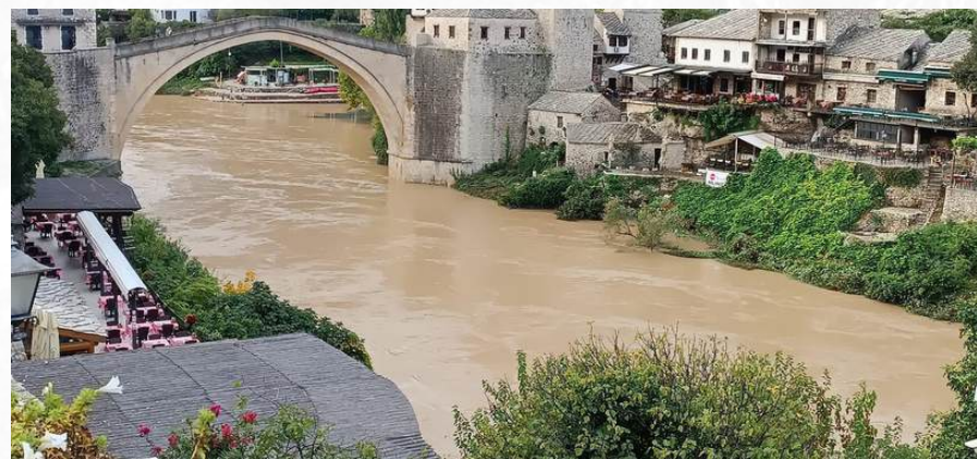
"Mostarski Stari most. Simbol izdržljivosti pred izazovima prirode."

Prema učesniku građanskog udruženja Nešto Više, oni organizuju izložbe i radionice koje naglašavaju efekte zagađenja plastikom i ostale izazove u smislu životne sredine. Dodatno, koriste digitalnu umjetnost i društvene mreže za diseminaciju moćnih poruka po pitanju životne sredine, čime stvaraju višestruk pristup zagovaranju.